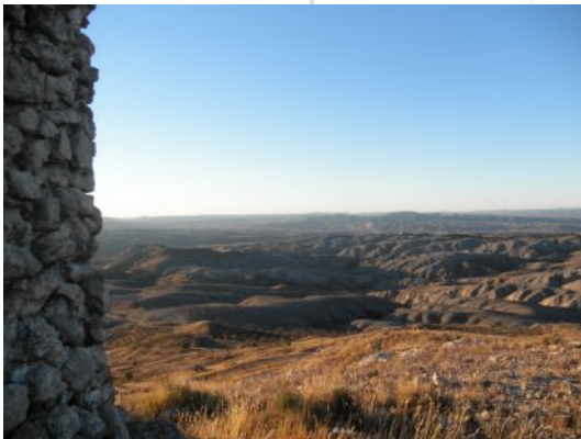
Vistas desde la Torrecilla

Su estratégica situación la vinculan con varias fortalezas de la zona. Tanto la torre como el resto de fortalezas cumplieron una función estratégica para la defensa de la fortaleza del Castillo de Ayud, centro neurálgico y coordinador no sólo del valle del Jiloca sino también de los valles y sierras aledañas. Se cree que la clave de este sistema defensivo estuvo en esta pequeña torre.